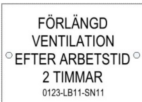
Figur: Skylt för förlängd ventilation efter arbetstid

Timer för förlängd drift ska vara utrustad med indikering som visar om timerfunktion är aktiv eller om aggregat är i drift. Timerfunktion med förändringsbara värden ska finnas i DUC. Skylt där funktion framgår ska monteras i anslutning till timer.