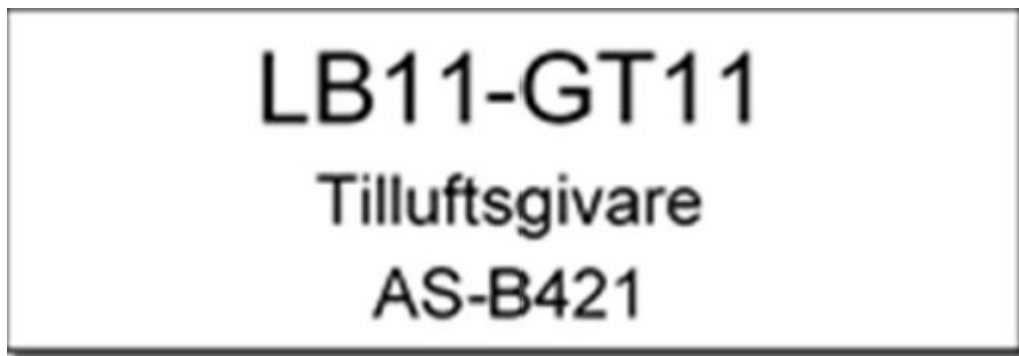
Figur: Märkskylt för apparat och komponenter

Skylt ska fästas med skruv alternativt med buntband av UVbeständig plast eller nylon på komponents elledning. Skylt ska inte fästas på lock.